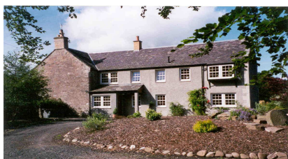
Gîte rural type - région de Perth

Plusieurs types d'hébergement sont proposés soit en Lodge de campagne ou Farm House au chaleureux confort typiquement britannique, soit en auberge rurale , au plus près des lieux de chasse, soit en hôtel soit encore pour ceux qui le souhaitent dans la propre maison du stalker (guide). C'est affaire de goût et de moyen financier.