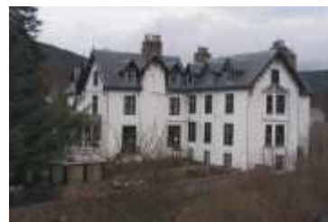
hôtel de charme